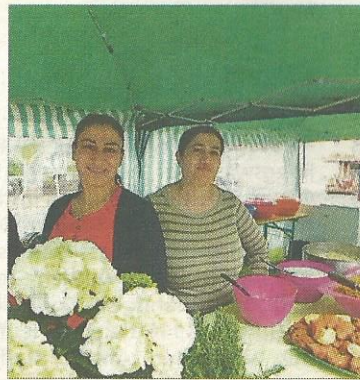
Die kurdische Gemeinschaft verkauft Kulinarisches an ihrem Stand.